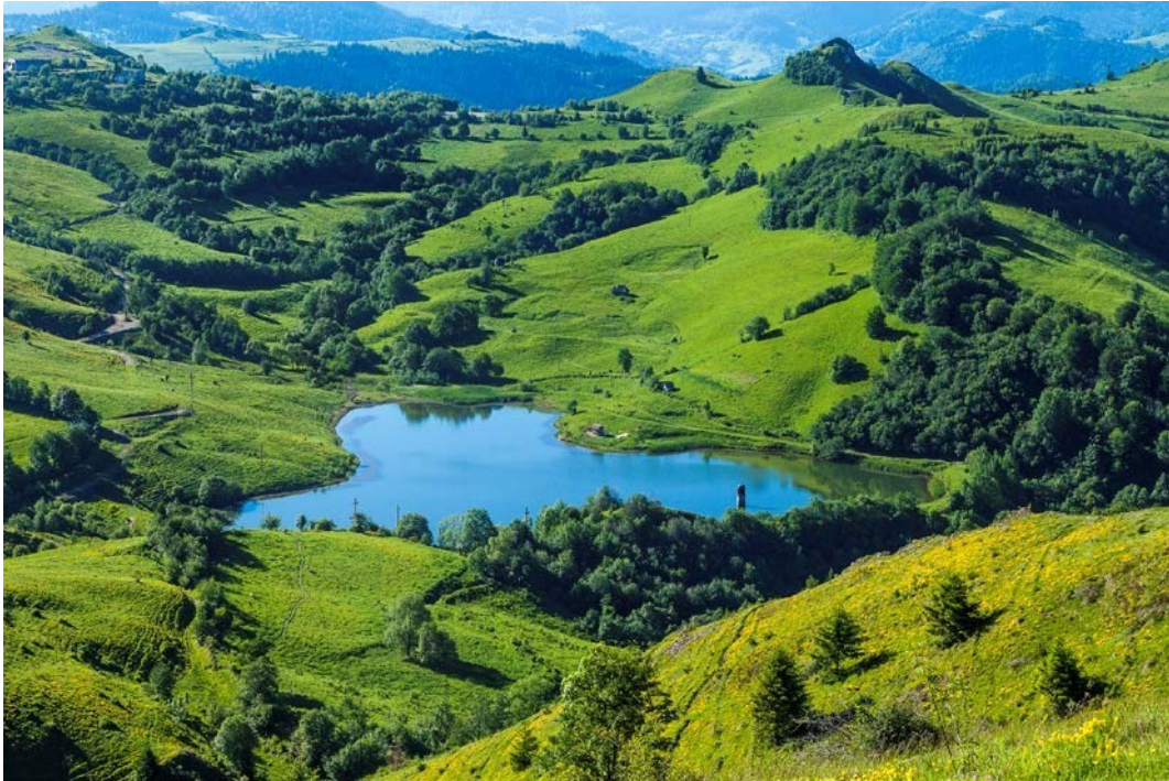
Vedere asupra Tăului Mare, Roșia Montană