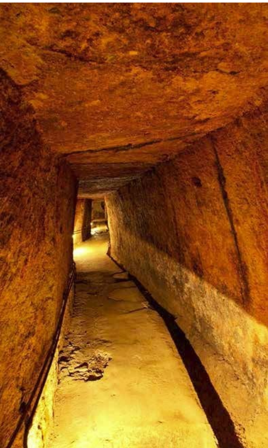
Galerie de exploatare minieră din epoca romană în Masivul Orlea