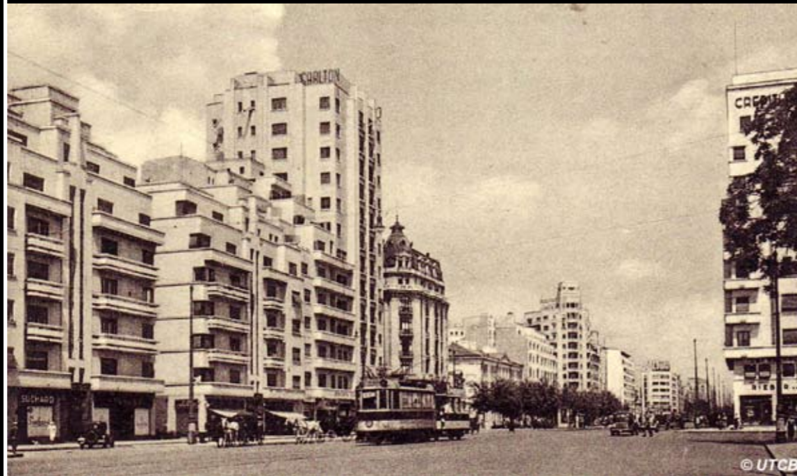
Fig. 1. Blocul Carlton înainte de cutremurul din noiembrie 1940