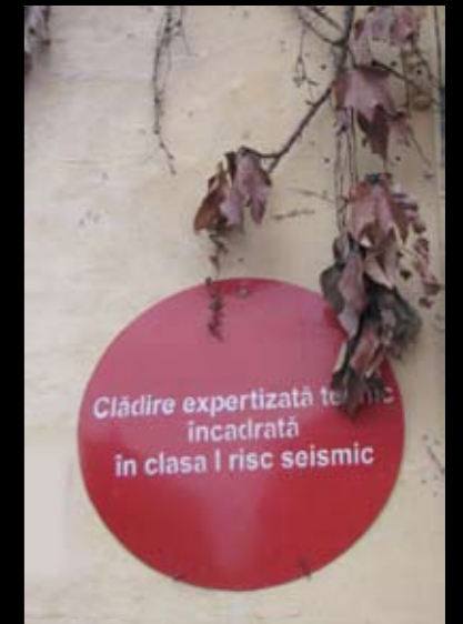
Fig.7. „Bulina roșie”