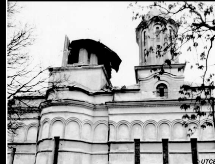
Fig. 5. 4 Martie 1977, Biserica Sf. Elefterie din București