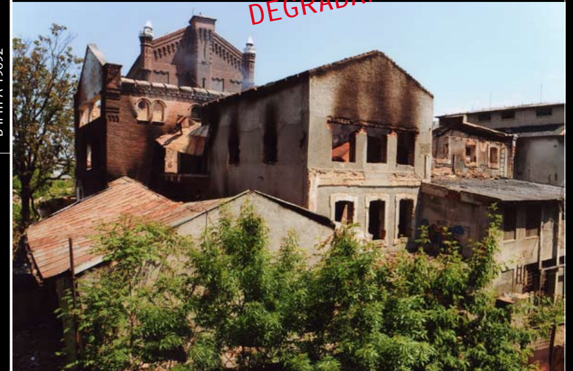
Ansamblu de clădiri agresat de incendiu.