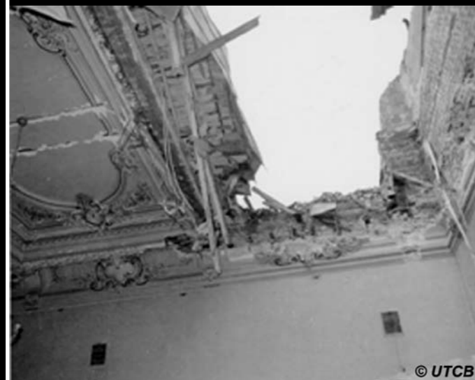
Fig. 4. 4 Martie 1977, Facultatea de Medicina, București