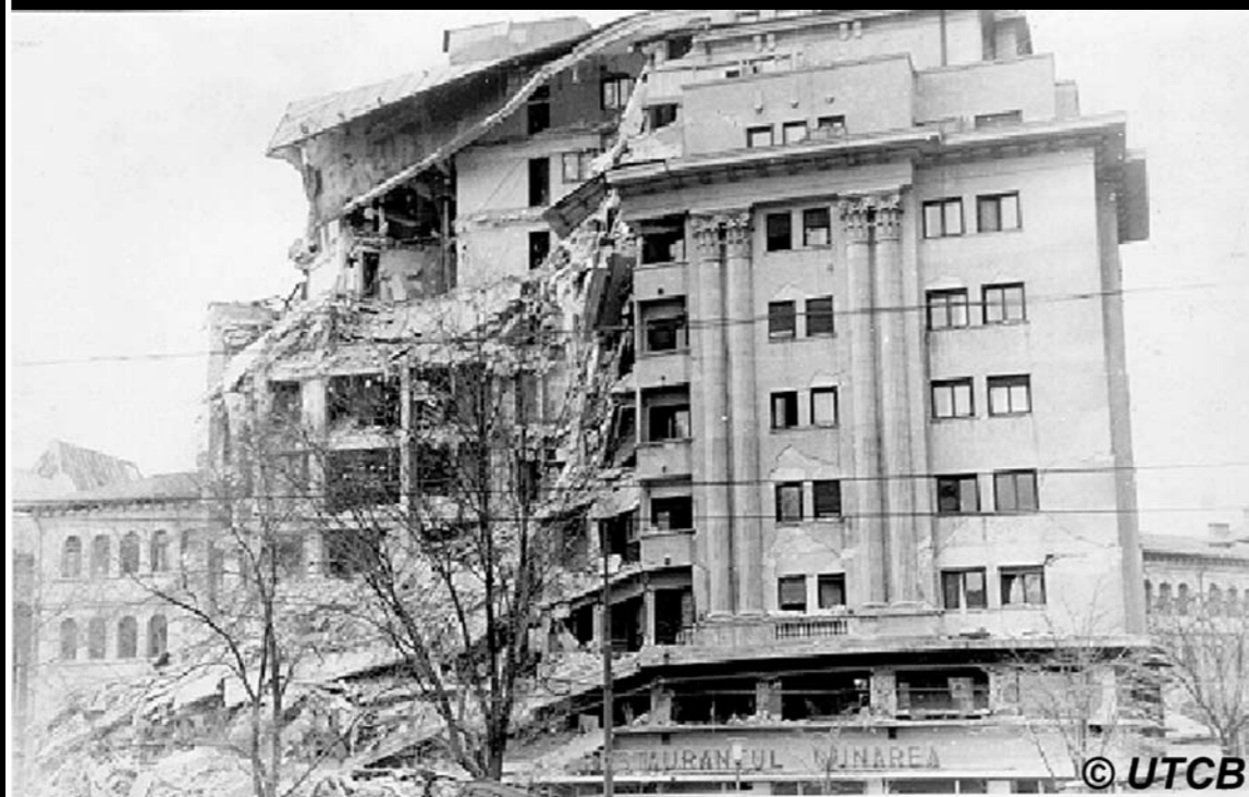
Fig. 2. 4 Martie 1977, Blocul Dunărea