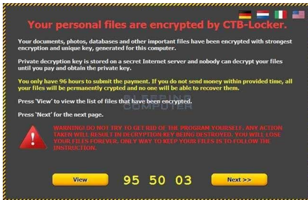
Figura 1. Mesaj afișat utilizatorilor în urma infecției cu CTB Locker

Pentru mai multe informații referitoare la această amenințare vă recomandăm parcurgerea articolului dedicat CTB Locker pe portalul CERT-RO: https://cert.ro/citeste/ransomware-ul-ctb-locker