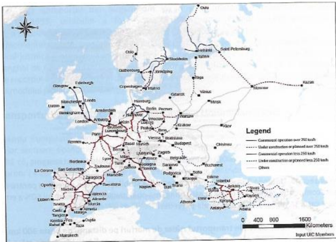
Fig. 37- Liniile de mare viteză din Europa-2015 — linii operate cu V > de 250 km/h; - - linii în construcție V > de 250 km/h; — linii operate cu V < de 250 km/h; - - linii în construcție V < de 250 km/h