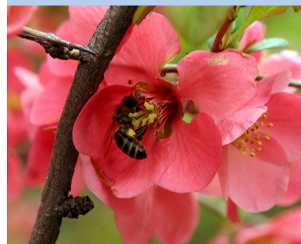
Flori avem, asteptam albinele să vină...